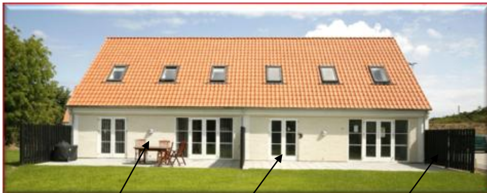
2.1 Facade 2.2 Vinduer og dør partier 2.3 Plankeværk